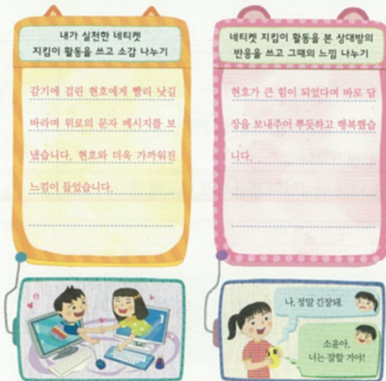
4. 밝고 건강한 사이버 생활

★ 네티켓 지킴이 활동을 실천해 보고 그때의 생각이나 느낌을 이야기해 봅시다.