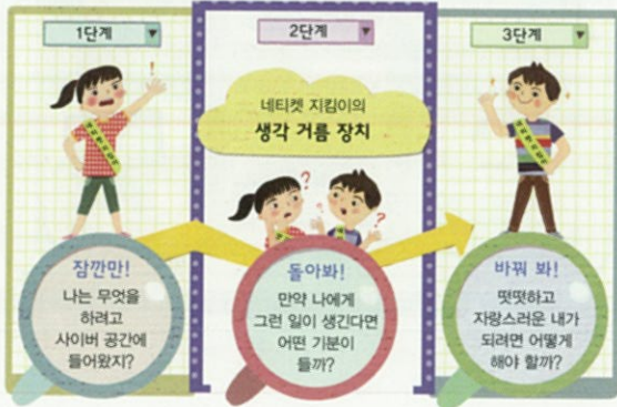
4. 밝고 건전한 사이버 생활